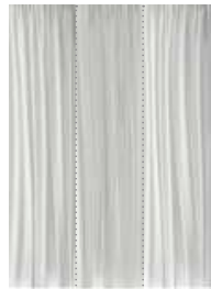
Cod. C1W C2W C3W Bianco