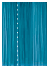
Cod. C1B C2B C3B Azzurro